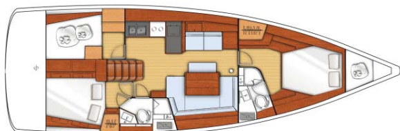
2 cabins - 2 heads / 2 cabines - 2 salles d'eau